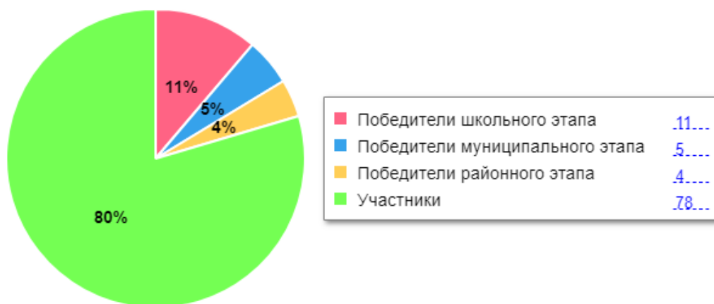
Диаграмма по результатам участия школьников во ВсОШ

В 2023 году был проанализирован объем участников конкурсных мероприятий разных уровней. Дистанционные формы работы с учащимися, создание условий для проявления их познавательной активности позволили принимать активное участие в дистанционных конкурсах регионального, всероссийского и международного уровней. Результат – положительная динамика участия в олимпиадах и конкурсах, привлечение к участию в интеллектуальных соревнованиях большего количества обучающихся Школы.